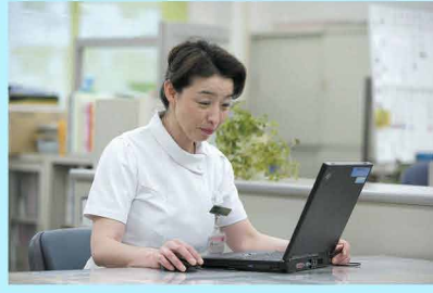
【管理者】 For manager's strategy plan

産休、育休、人事異動、新人ナースの戦力化時期など、従来、責任者の経験や間隔に依存する傾向が強かった年間の看護管理計画に必要な情報を統合。計画の根拠を明らかにすることは、全員が同じ視点で病棟運営にあたることにつながり、看護の質の維持・向上を全員で目指す態勢構築に役立ちます。また、病棟間の目標管理や取り組みなどを積極的に開示することで、自発的なキャリア発見の機会を公平に提供。双方が目標に対する達成度を定期的に確認しながら、適切な戦力配置と指導に取り組みます。