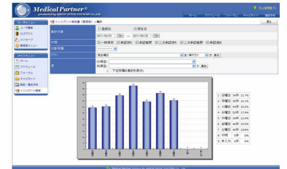
※その他に、表形式・折れ線グラフ・横棒グラフで表示が可能です。