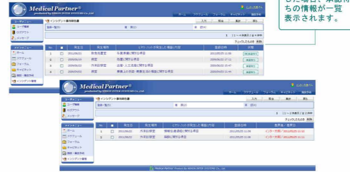
※承認者の判断で、承認・差戻しを行います。

登録されたレポートは、承認者が確認を行い、適切でなければコメントを付けて登録者に差戻しすることも可能。登録者は差戻されたレポート情報を再度確認し、修正後、再登録を行うことができます。これにより、より正確なレポート作成をバックアップします。