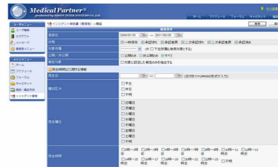
※登録レポートは管理者または承認者の権限で検索・照会し、閲覧・編集・削除が可能です。

登録されたレポート情報は、管理者や承認者の権限により検索し、照会することが可能です。さらにレポート情報を印刷して利用することも可能です。また、管理者はレポート情報をCSVファイルにて保存し、手軽に編集することができます。