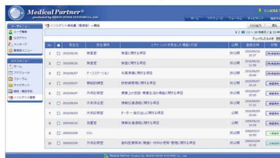
※一覧表示された登録レポートは、詳細情報の印刷機能やCSV出力機能により、幅広いご利用が可能です。