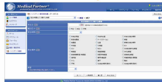
※項目を独自に変更することも可能です。